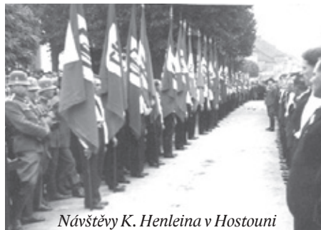
Návštěvy K. Henleina v Hostouni

Československa se krize dotkla citlivě v první polovině třicátých let. Sudety – důležité pohraniční území osídlené převážně německým etnikem – byly jakožto průmyslová oblast zasaženy nejvíce. Postupem času se sudetští Němci začali – i pod vlivem podmanivé rozhlasové propagandy z Německa – odklánět od československé demokracie a svoji budoucnost začali spojovat s německou Třetí říší.