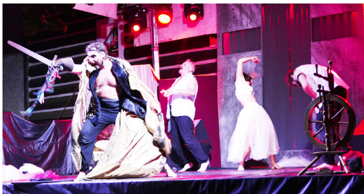
Metropolitní divadlo z Prahy představilo divákům Erbenovu Kytici.