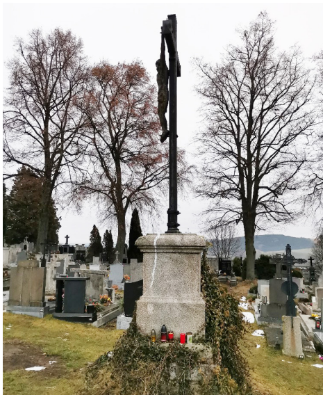
Kříže před restaurováním