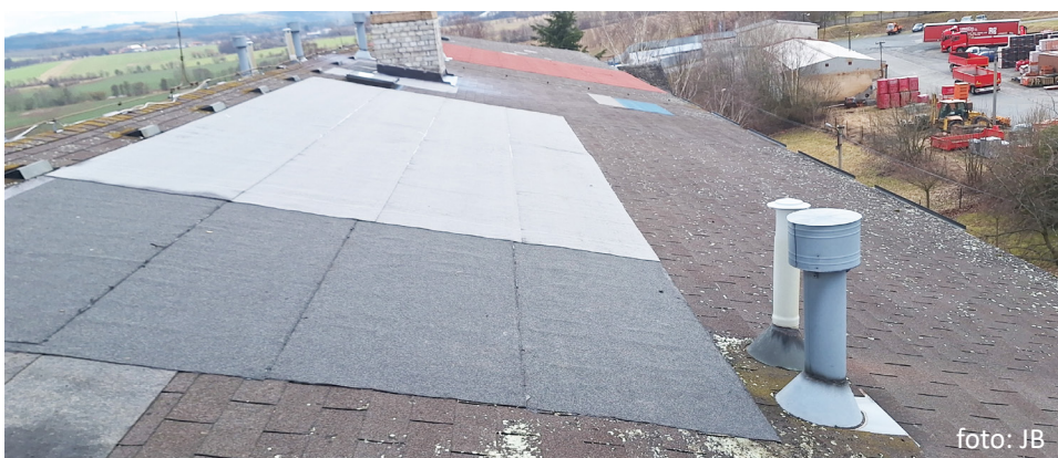
Střecha na objektu čp. 330 před rekonstrukcí