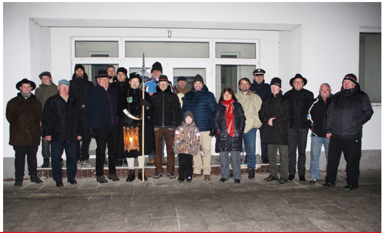
Závěr roku 2024 a začátek roku 2025 patřil tradičnímu setkání s přáteli z Bavorska. Nejprve jsme si vzájemně poděkovali za spolupráci v roce předchozím na bývalé celnici v obci Lísková a na Nový rok opět společně vystoupali na nejvyšší vrchol Českého lesa.